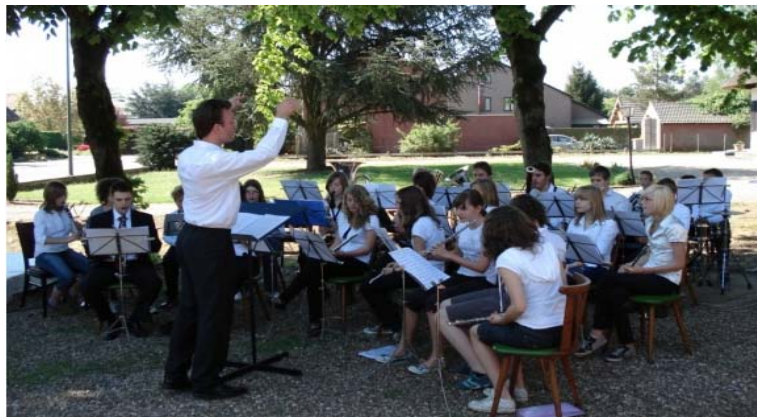
Mis Heikant 2008